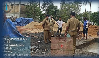
Cek Lapangan Permohonan IMB